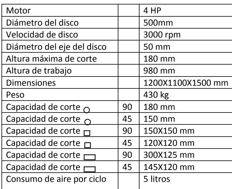
DIAGRAMA DE CORTE