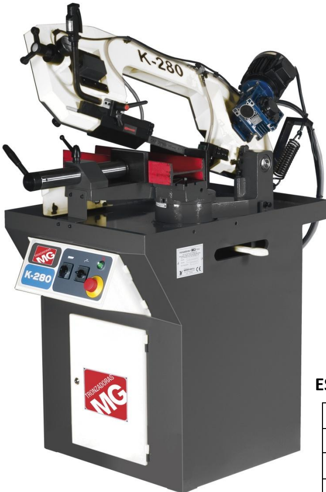
DETALLE BAJADA HIDRAULICA