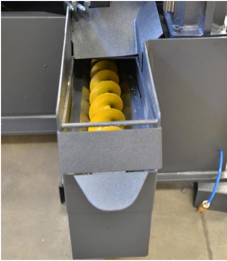
EXTRACTOR DE VIRUTAS (OPCIONAL)