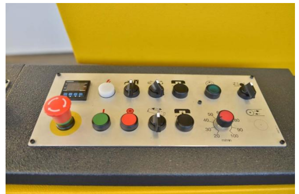
CUADRO DE MANDOS (DE SERIE)