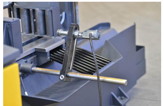
TOPE DE 500 mm.(DE SERIE)