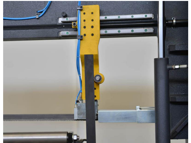
PRISMAS CON RODAMIENTOS EN LAS GUIAS (DE SERIE)