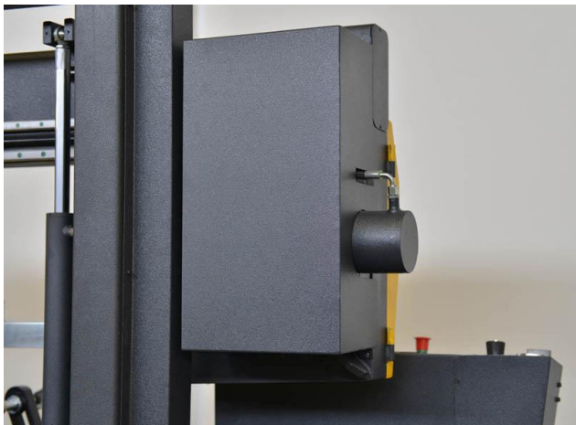
TENSADOR HIDRAULICO CINTA (OPCIONAL)